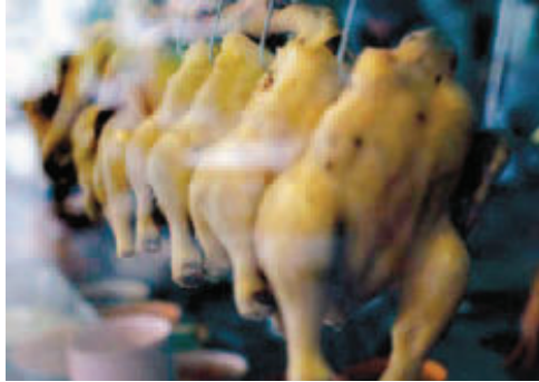
Entre outros alimentos, a Alfândega apreendeu carne de pato e galinha

constituíram as 16,1 toneladas destinados ao consumo, que a DGAIEC (Direcção-Geral das Alfândegas e dos Impostos Especiais sobre o Comércio) apreendeu, na quarta-feira, no porto de Lisboa. Em pouco mais de um mês, são já 34,8 toneladas de produtos oriundos da mesma região que, segundo as autoridades, constituiriam uma ameaça à saúde pública. As mercadorias, avançou a DGAIEC, «estavam acondicionadas num contentor» e a sua introdução no mercado comunitário iria ser feita